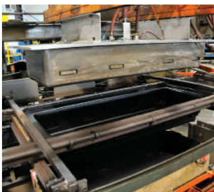
Vacuum mold for keyboard case

1997年SKB投资滚塑成型机器，用于生产大型包装箱。这种PE滚塑成型产品，最先是依照箱子大小计量出所需粉末量开始，封装在多片组合铝模内，并固定在轮轴上，在一个大烘炉内不停的滚动加热到800度，粉末融化涂覆在模具上，冷却后拆卸铸件，箱子即可取出。滚塑成型对装纳产品提供极大化的保护及防撞击。